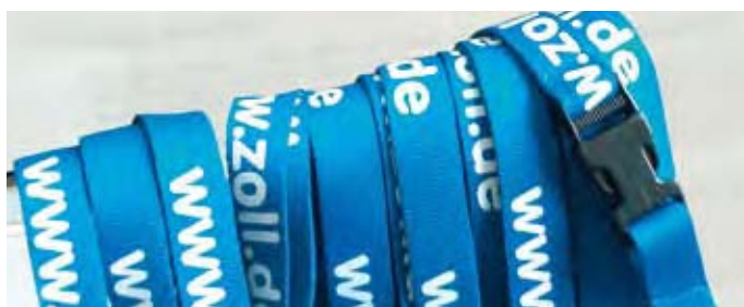
Confiscation by Customs

Border seizures by the Customs authorities are an effective method of preventing the exhibition of imitations even before a trade fair opens. Customs check merchandise that is being imported or exported or is in transit from non-EU countries to see whether it contains products that infringe protected rights. These inspections are carried out at all borders. Customs' work includes monitoring and inspection at Inland Customs offices and free ports, as well as by mobile control units.