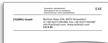
»Aussteller alphabetisch«, Obligatorisches Medienpaket