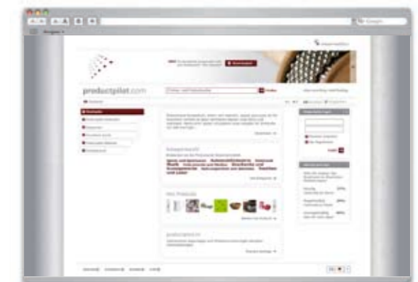
Business-to-Business Portal: productpilot.com