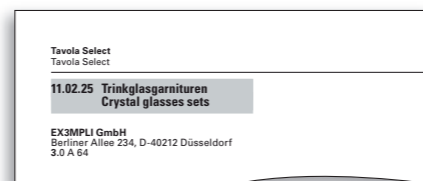
»Aussteller nach Produktgruppen«, Paket 1 am Beispiel der Ambiente